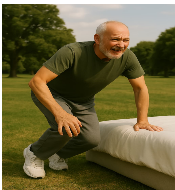
Beine abstützen und drücken können