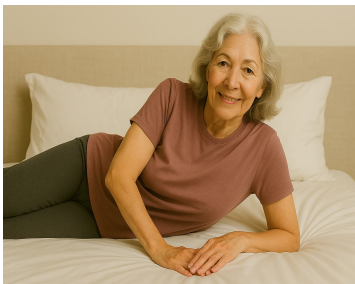
Arme abstützen und drücken können

Ideen zu den einzelnen Bewohnern und bei mir hier draufschreiben