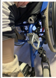
Hervorstehende scharfkantige Anschnallösen