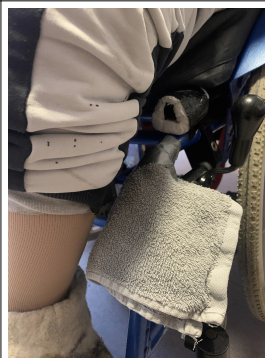
Abpolstern der Ösen