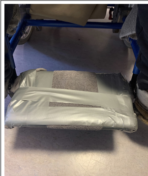
Abpolstern der Beinstützen mit Panzertape