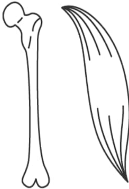
Knochen – Muskeln